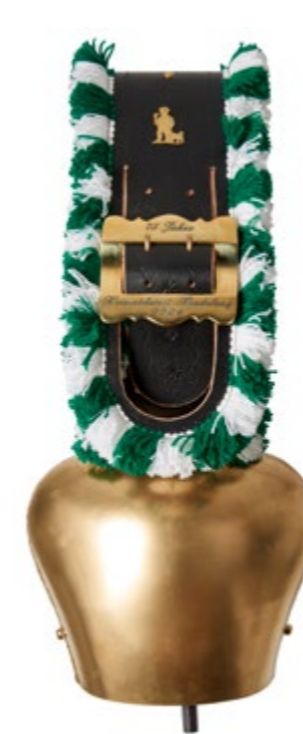
Kleine Zugschelle »Bumpele« Geschmiedet von Max Beßler Riemen gefertigt von Alfred Füß Mindestgebot 300,- €