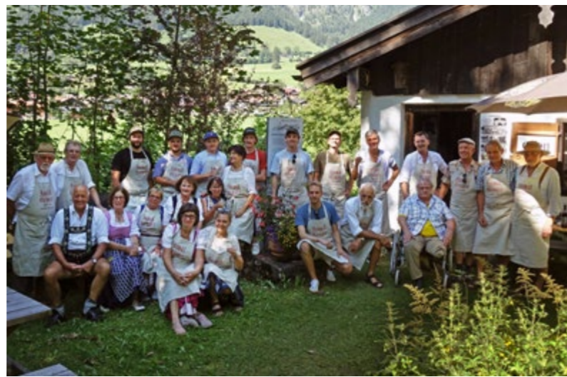
's Edelweissrio aus Burgberg unterhielt nachmittags, die Jodlergruppe aus Vorderburg begleitete musikalisch den Gottesdienst und apropos Dienst: ein guter Teiler Helfer (genannt Huimatdienar und -dienare) formiert zum Gruppenfoto und »dr Schindlmocher« aus Schwangau. Jubiläumsweinglas 0,2 l