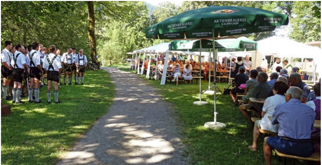
Jubiläumsfeier und Schmittfescht im Lohwäldle; Die Jodlergruppe Vorderburg untermalt den Festgottesdienst